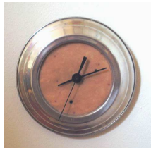
Philippe Mayaux La pendule, 1999 Aluminium, résine et mécanisme d'horloge Edition de 12 exemplaires numérotés et signés Epuisé