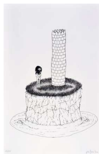
Julie Faure-Brac Le tour de la tour, 2006 Sérigraphie 55 x 37,5 cm Edition de 50 exemplaires numérotés et signés - Prix de vente Amis du Frac : 150 € - Prix de vente public : 250 €