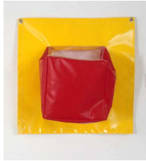
Stéphane Calais C'est le chapeau qui... (3), 1997 Bâche PVC 50 x 50 x 24 cm Edition de 10 exemplaires numérotés et signés Epuisé