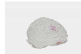
Marco Godinho Local Citizen Everywhere, Your Presence is not Lost, 2007 Cristal, encre 7 x 6 x 4 cm Edition de 50 exemplaires numérotés et signés Epuisé