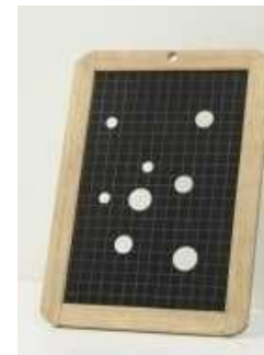
Sébastien Gouju Lapse of, 2008 Ardoise percée, bois, boîte cartonnée 22 x 34 cm Edition de 50 exemplaires numérotés et signés - Prix de vente Amis du Frac : 180 € - Prix de vente public : 200 €