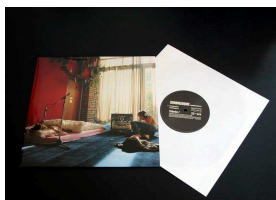
Laurent Montaron Somniloquie, 2003 Disque vinyle et pochette cartonnée 26 x 26 cm Edition de 33 exemplaires numérotés et signés Epuisé