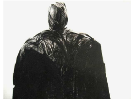
Christian Lapie Mon ombre en attendant la pluie, 2005 Eau forte 80 x 120 cm Edition de 40 exemplaires numérotés et signés Epuisé