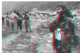
Benoît Broisat Anaglyphe (Halabja), 2005 Impression numérique, lunettes 3D 60 x 100 cm Edition de 100 exemplaires numérotés et signés Epuisé