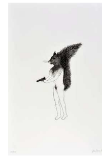
Julie Faure-Brac Braquage, 2006 Sérigraphie 55 x 37,5 cm Edition de 50 exemplaires numérotés et signés - Prix de vente Amis du Frac : 150 € - Prix de vente public : 250 €