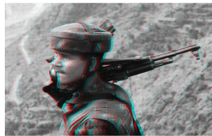
Benoît Broisat Anaglyphe (Kashmir), 2005 Impression numérique, lunettes 3D 60 x 100 cm Edition de 100 exemplaires numérotés et signés Epuisé