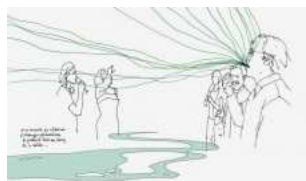
François Matton Sans titre, 2006 Impression numérique 60 x 90 cm Edition de 50 exemplaires numérotés et signés - Prix de vente Amis du Frac : 150 € - Prix de vente public : 250 €