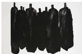
Christian Lapie Aquafortis, 2001 Eau forte 80 x 120 cm Edition de 25 exemplaires numérotés et signés Epuisé