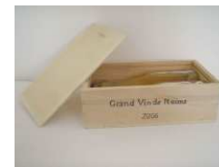
Nicolas Boulard Grand vin de Reims, 2007 2 demi-bouteilles, coffret en bois, carte des cépages 32 x 24 x 10 cm Edition de 50 exemplaires numérotés et signés - Prix de vente Amis du Frac : 190 € - Prix de vente public : 240 €