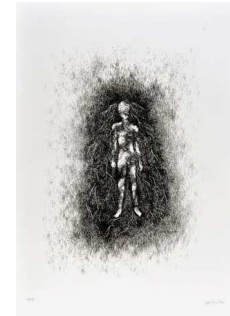
Julie Faure-Brac Je suis mort, 2006 Sérigraphie 75 x 55 cm Edition de 50 exemplaires numérotés et signés - Prix de vente Amis du Frac : 200 € - Prix de vente public : 340 € Prix spécial pour l'acquisition des 3 multiples de Julie Faure-Brac : - Prix de vente Amis du Frac : 400 € - Prix de vente public : 660 €