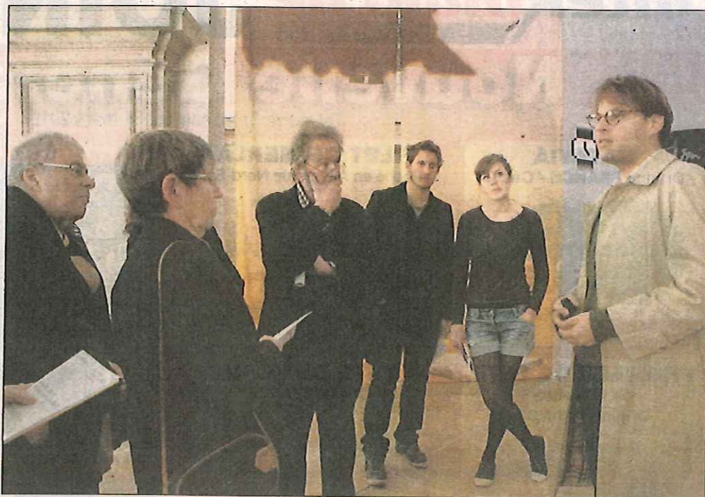
Les visiteurs devant l'œuvre d'Helen Marten : de grands voiles de crêpe de Chine tapissés d'images cueillies sur internet.

Exposition ouverte les lundi mercredi jeudi et vendredi de 14 h 30 à 18 h 30, le samedi de 10 h à 13 h et de 14 h à 18 h 30, le dimanche de 14 h à 18 h 30. Entrée libre.